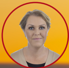
Lena Hallengren Ordförande S-riksdagsgrupp