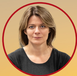
Johanna Haraldsson Riksdagsledamot, Jönköpings län